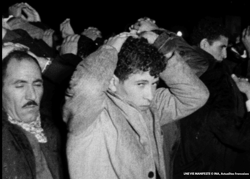
UNE VIE MANIFESTE