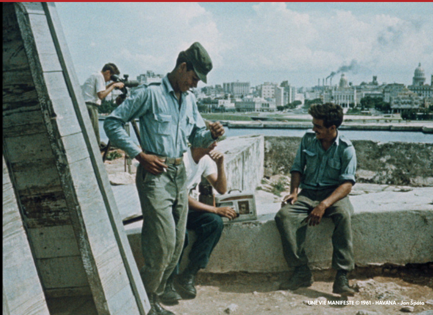
UNE VIE MANIFESTE © 1961 - HAVANA - Jan Špata